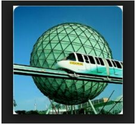
IMAGEN EXPO 92

La Expo 92 es la Exposición Universal de Sevilla 1992, la capital de Andalucía y fue conocida popularmente como: "Expo 92" o "La Expo". Su mascota es el conocido Curro, un pájaro con pico y cresta multicolor.